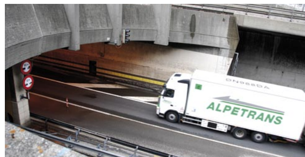
Le volume du trafic routier de transit au Gothard a déjà atteint les limites du supportable!

Une initiative cantonale des Jeunes UDC Uri, réclamant un deuxième tunnel «sans augmentation de capacité», a été rejetée en décembre 2010 par le gouvernement et le parlement uranais. En même temps, ce dernier a apporté son soutien à un contre-projet du gouvernement proposant un «tunnel de remplacement» et le renoncement (provisoire) à la réfection de l'actuel ouvrage. Depuis 1994,