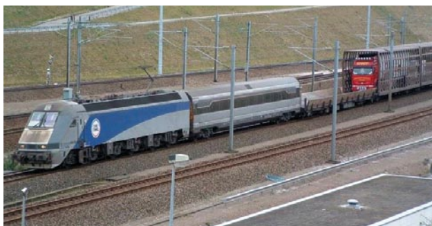
Train de feroutage sur la ligne du tunnel sous la Manche

En 2009, l'Office fédéral des routes a fait savoir que le tunnel routier du Gothard devrait être assaini plus tôt que prévu. Cette annonce a remis le dossier «Gothard» sur le devant de la scène. L'Initiative des Alpes a élaboré, avec le concours d'un groupe d'experts, une proposition de double chaussée roulante pour l'acheminement de l'ensemble du trafic routier durant les travaux de réfection du tunnel – l'une pour les voitures entre Göschenen et Airolo par l'ancien tunnel de faîte, l'autre pour les camions entre Erstfeld et Biasca à travers le nouveau tunnel de base. Cette proposition est devenue entre-temps la solution officielle préconisée par la Confédération. Dans