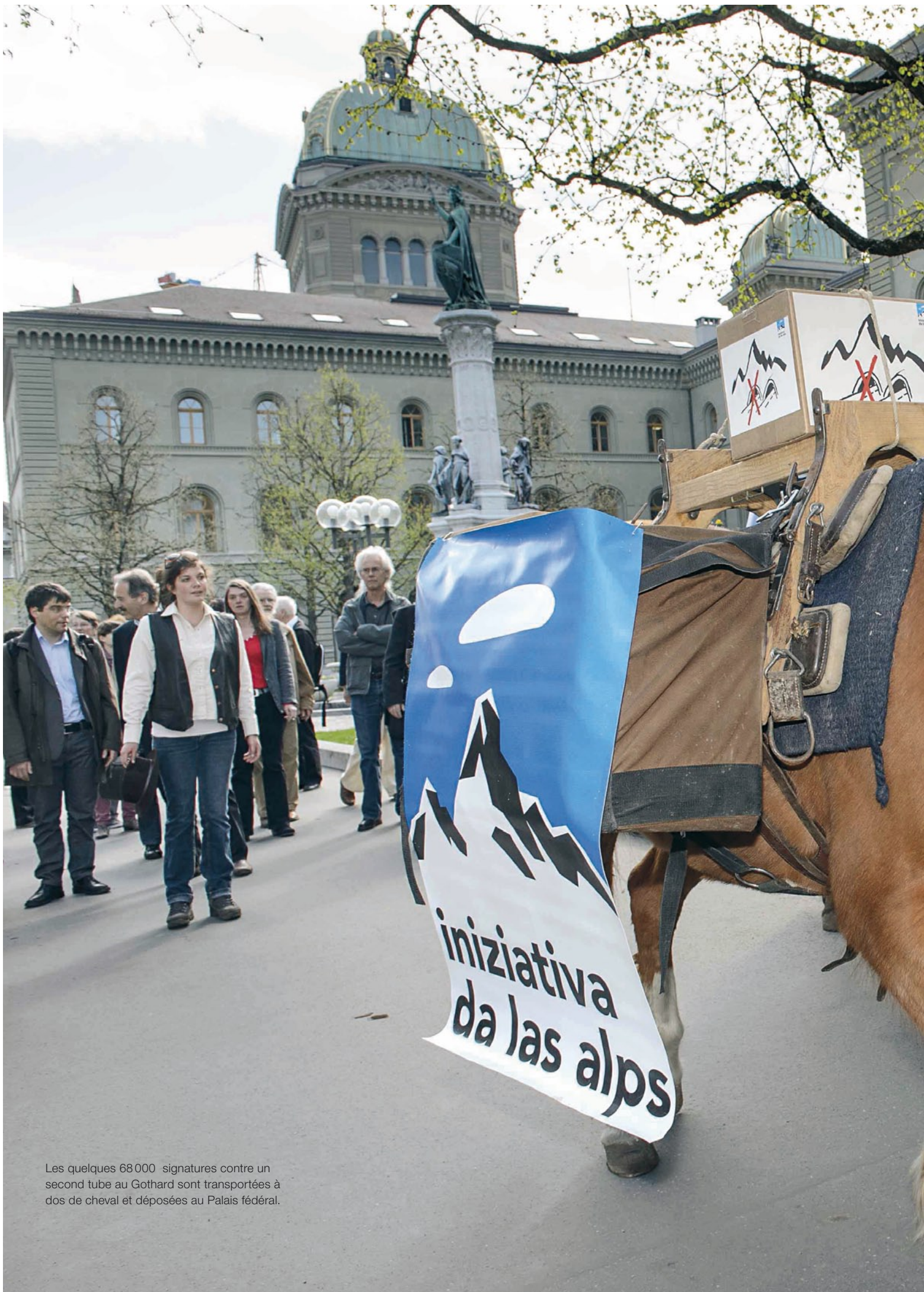
Les quelques 68 000 signatures contre un second tube au Gothard sont transportées à dos de cheval et déposées au Palais fédéral.