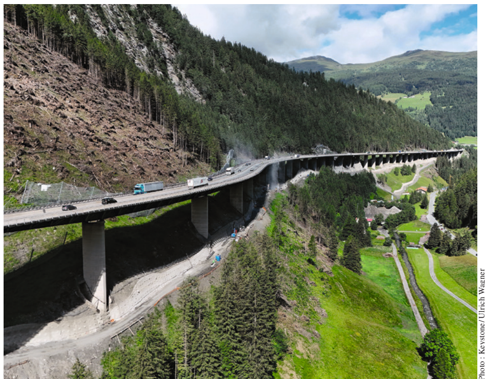
Le pont Luegbrücke, le plus long pont de l'autoroute autrichienne du Brenner, est fortement endommagé.

Cet article a été écrit par Silvan Gnos . Nous nous réjouissons que Silvan ait à nouveau rejoint l'Initiative des Alpes après un stage passé chez nous il y a cinq ans et son engagement continu au Conseil des Alpes. Après l'obtention de son master en sciences politiques et une activité dans la régulation chez CFF Cargo, ce natif d'Obwald a rejoint le secrétariat en juillet 2024 en qualité de responsable de la politique en faveur de la protection des Alpes. Amateur de randonnées, de varappe et de vélo, Silvan aime les Alpes et y passe beaucoup de temps. Il considère son engagement pour l'Initiative des Alpes comme une contribution importante en faveur d'une politique des transports durable dans l'espace alpin.